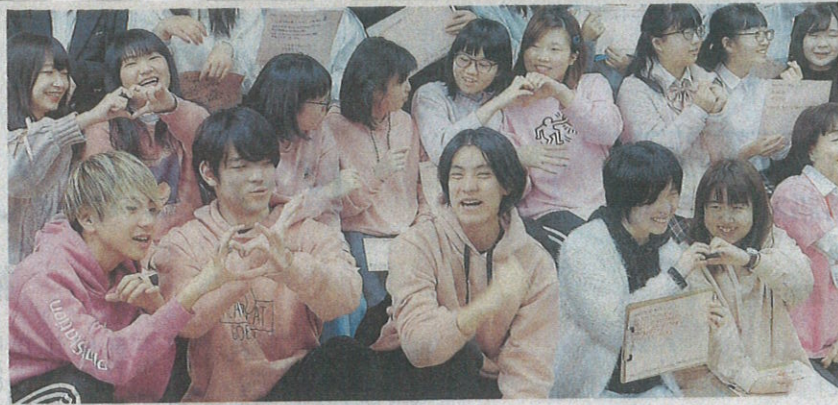
思い思いのピンク色を身につけて記念写真を撮る生徒たち。大阪YMCA国際専門学校