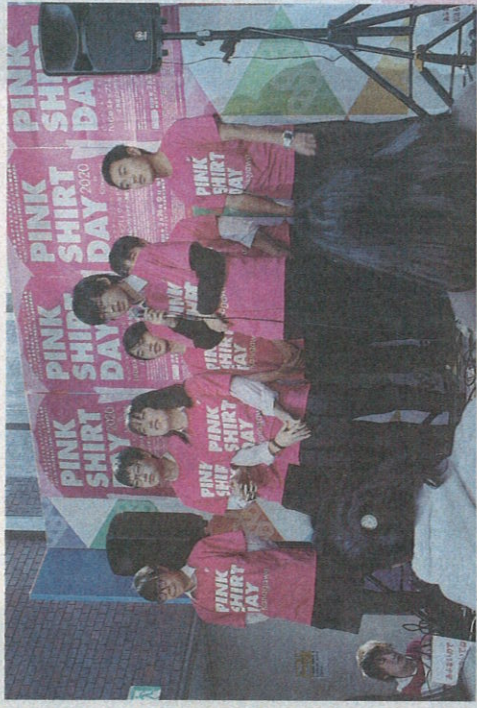
イベントのステージに立ち、26日に学校で行うピンクシャツデーの計画を話す 横浜市立東高校サステイナブル研究部の生徒たち=9日、神奈川県横浜市

2月の最後の水曜日に、ピンク色のシャツや小物を身に付けて「いじめ反対」の思いを表現しよう。カナダの高校生からスタートした「ピンクシャツデー」の取り組みが、日本でも広がりはじめます。最終水曜日の26日までに、今年初めて学校でやってみようという高校生や、いじめの問題について考えてみる小学生もいます。(中山)