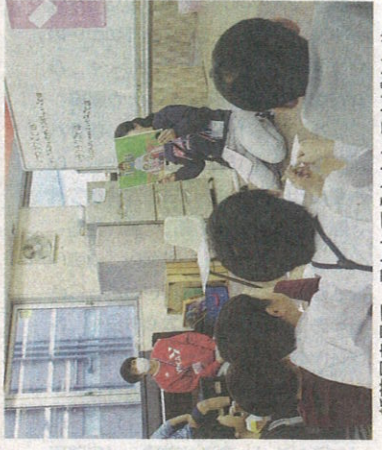
紙芝居を見て、重ねてうれしかったことばといやなことばを考えた横浜中央YMCAのアフタースクールの小学生たち=12日、横浜市

歳)が読み聞かせる絵本「盾を見つめました。ピンクシャツデーの始まりとなった。2017年のカナダの高校での出来事をまなめたお話を、ピンク色のポロシャツを着て登校した男の子がいじめられたのを知った上級生の男の子2人が「あす、ピンク色のシャツを着て登校しよう」と友だちに呼びかけます。