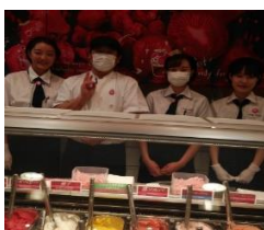
タカナシ乳業店舗