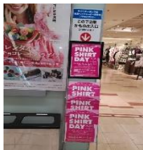
そごう横浜店各階