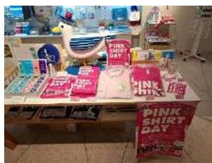
横浜マリンタワーショップ