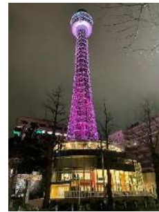
横浜マリンタワー