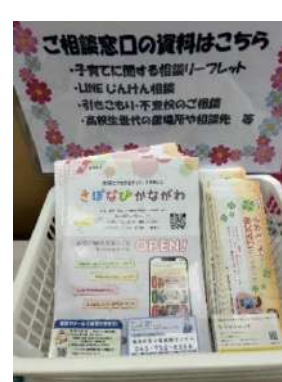
相談窓口のご紹介