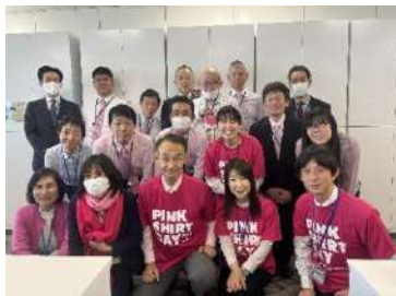
横浜市教育委員会事務局