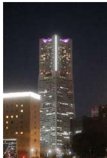
横浜ランドマークタワー