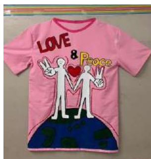
選ばれたデザイン